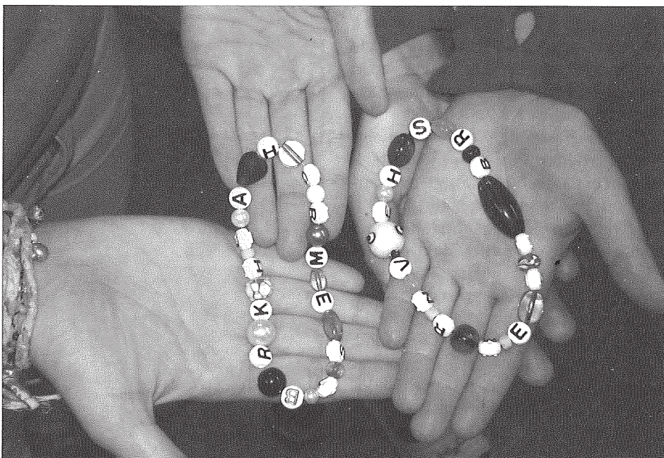
› Gebetsketten der Konfirmanden

Beten war einmal eine selbstverständliche Übung in vielen Familien. Das ist schon lange nicht mehr so. So einfach das Beten ist, es will doch gelernt sein. Sechzig Konfirmandinnen und Konfirmanden, die sich Anfang Februar während ihrer Konfirmandenfreizeit in der Jugendherberge in Westensee mit dem Gebet beschäftigten,