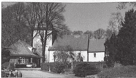
› St. Petri-Kirche in Bosau

„Vicelin“ begegnet uns in der Gegenwart hauptsächlich als Name von Kirchen. Der ursprüngliche Namensträger lebte ungefähr von 1090 bis 1154, war Missionar und Bischof, gilt bis heute als Heiliger und wird als der Apostel der Wagrier bezeichnet. Damit ist er einer der „Kirchenväter“ Nordelbiens. Vor allem mit den von ihm veranlassten Kirchenbauten prägte Vicelin die kirchliche Topographie in Altholstein und im späteren Ostholstein. Im Sommer 1152 weihte der Bischof die St. Petri-Kirche in Bosau. Dorthin soll unser Ausflug uns am Mittwoch, 22. Juni 2011, führen.