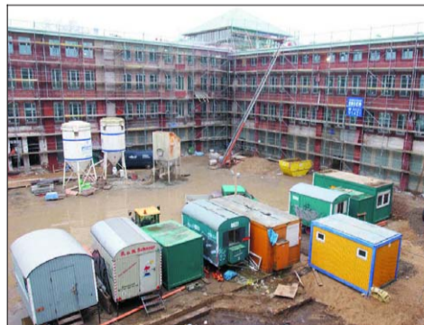
Blick ins Innere des Neufeldt-Hauses: Die Arbeit geht voran. Fotos eis